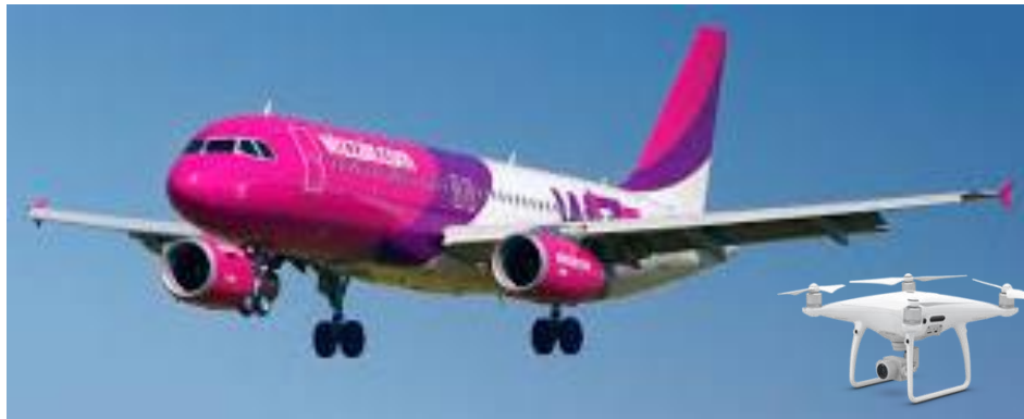
המחשה של רב להב והמטוס נשוא התקרית (לא בקנה מידה)

ביום שבת, בתאריך 10 ליוני 2017, בשעה 08:35 לערך, מטוס נוסעים של חברת WizzAir, מדגם Airbus A320 בתהליך סטנדרטי של נחיתת מכשירים, למסלול 12 בשדה התעופה בן גוריון, נאלץ לבצע תמרון קל כדי להתחמק מפגיעה ברחפן (רב להב). הקברניט דיווח למגדל הפיקוח שהפעיל מידית את הנוהל המתאים, כולל הפעלת המשטרה. המטוס המשיך בגישה ונחת ללא אירועים מיוחדים. המשך הנחיתות על המסלול היו ללא הפרעה. האירוע דווח לחוקר הראשי ע"י המגדל ולפני מספר ימים הגיעו תוצאות התחקור של WizzAir.