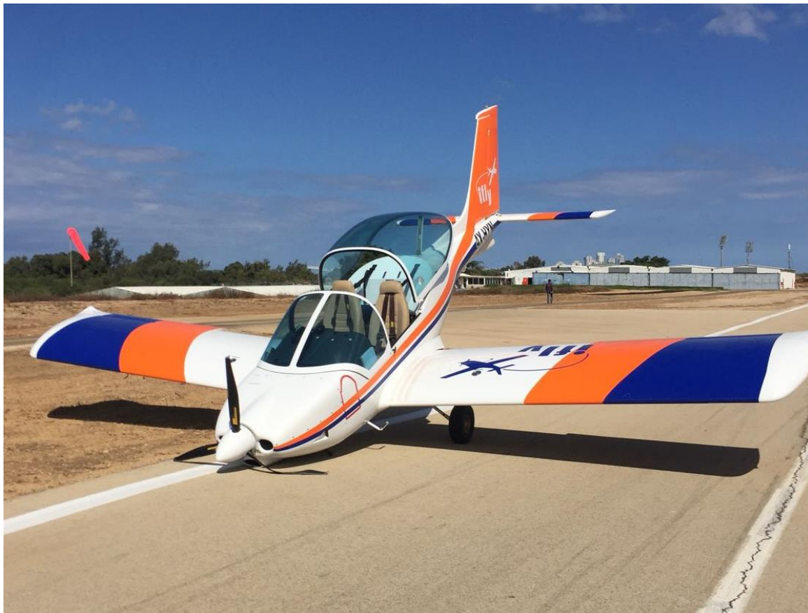
המטוס נשוא התאונה לאחר שנעצר

ביום שני, בתאריך 10.10.2017 בשעה 10:45, לערך, בעת נחיתה של חניך טיס, בטיסת סולו עם אז"מ מסוג טקסון, על מסלול 18 במנחת ראשלי"צ (להלן: "מנחת ראשון"), התפתח תהליך "קנגורו" שהסתיים בקריסת כן הנסע הקדמי ונזק לפרופלור, עקב פגיעת להביו במסלול. המטוס התחכך מספר עשרות מטרים על גחונו הקדמי עד שנבלם, סמוך לשול הימני של המסלול. חניך הטיס לא נפגע באירוע ויצא בכוחות עצמו מהקוקפיט. מדריך הטיס שעמד ליד המסלול, עם מכשיר קשר, רץ למטוס, ולאחר שוודא שהחניך בסדר, צילם את המטוס ופינה אותו לקושרת הסמוכה. מיד אח"כ, המדריך דיווח לחוקר הראשי על התאונה והמתין עם החניך להגעת החוקר שנשלח לבדיקת נסיבות התאונה.