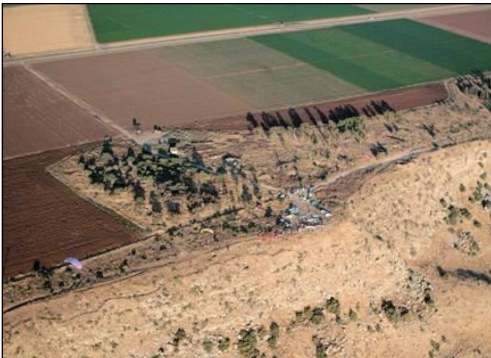
אתר מבוא חמה מהאוויר

האירוע המפורסם להלן הגיע לידיעת החוקר הראשי רק בתאריך 10.10.2017, למעלה מחודשיים לאחר שהתרחש, בעקבות פרסום סרטון שבו תועדה התאונה – בעקבות כך, המרחף אותר והפרסום מבוסס על גרסתו לאירוע וצפייה בסרטון. המרחף נשוא התקרית היה חניך בקורס רחיפה (להלן: "החניך"), בן 23, שהיה בעת התאונה בשלב מתקדם של הקורס. בתאריך 4.8.2017, החניך יצא לרחיפה מאתר הרחיפה במבוא חמה כשמדריכו באתר. אותה השעה שררה רוח דרום-דרום-מערבית. בגמר הרחיפה, החניך ניגש לנחיתה למרגלות ההר, סמוך לכביש הסובב את הכנרת ממזרח. בצלע הבסיס לנחיתה, החניך ביצע 360 מעלות, תוך שהמצנח היטלטל וכתוצאה מכך, עם רכיב גב של הרוח, החניך נכנס לשקיעה חזקה יחסית ופגע בקרקע. החניך הובהל לביי"ח פורייה ולאחר שאובחנו אצלו שלוש חוליות שבורות הוא הועבר לניתוח בביי"ח תל השומר שם אושפז למשך יותר מעשרה ימים.