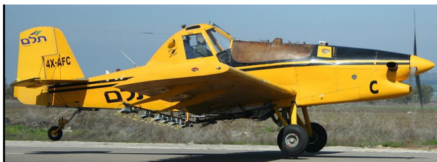
מטוס המעורב באירוע

האירוע דווח לחוקר הראשי שתאם עם הטייס על פרסום התחקיר האישי של הטייס.