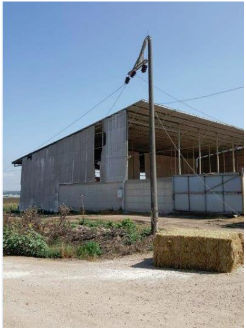
העמוד שנפגע והחוטים שנקרעו