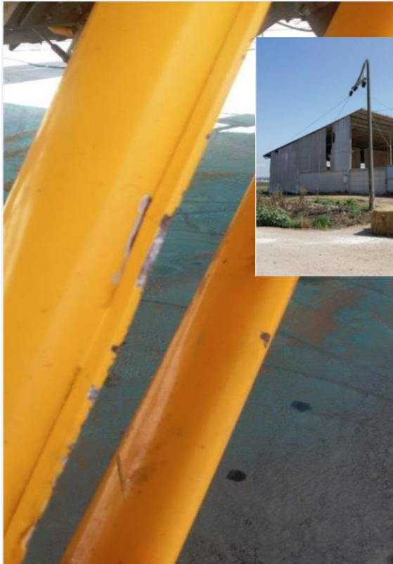
סימני פגיעה בכך הנסע