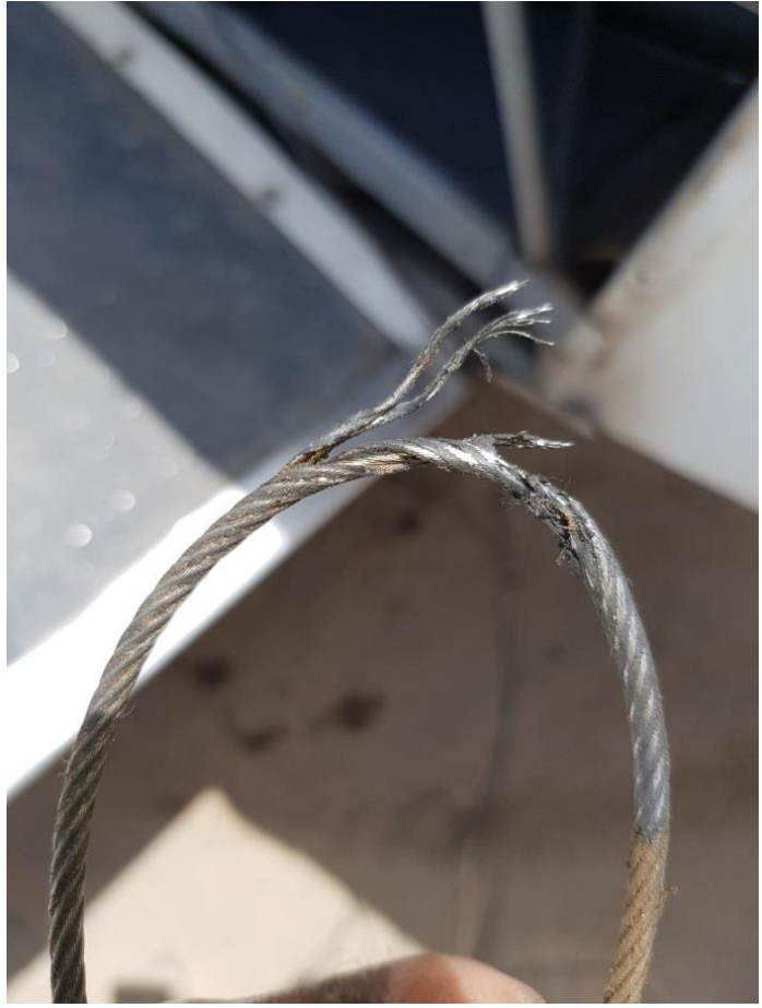
אזור הגידים הקרועים בכבל הגה גובה