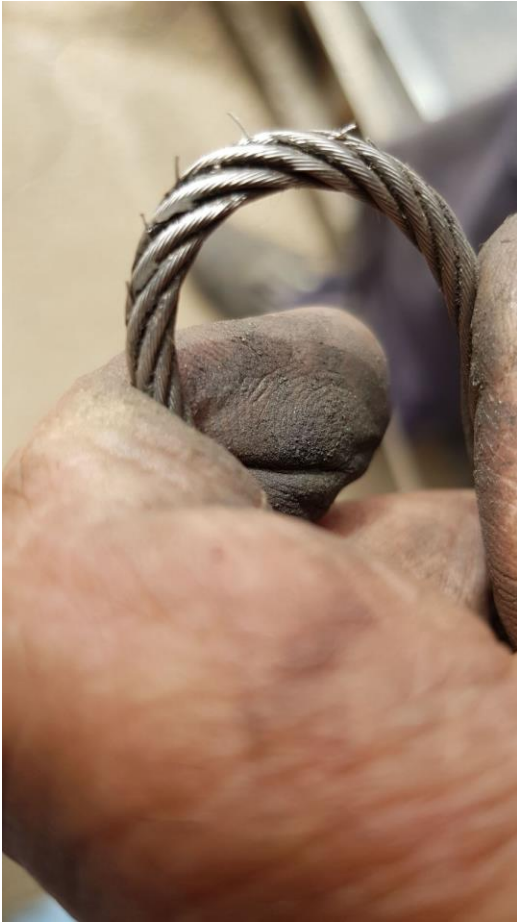
כבל מאזנות עם סיבים בולטים