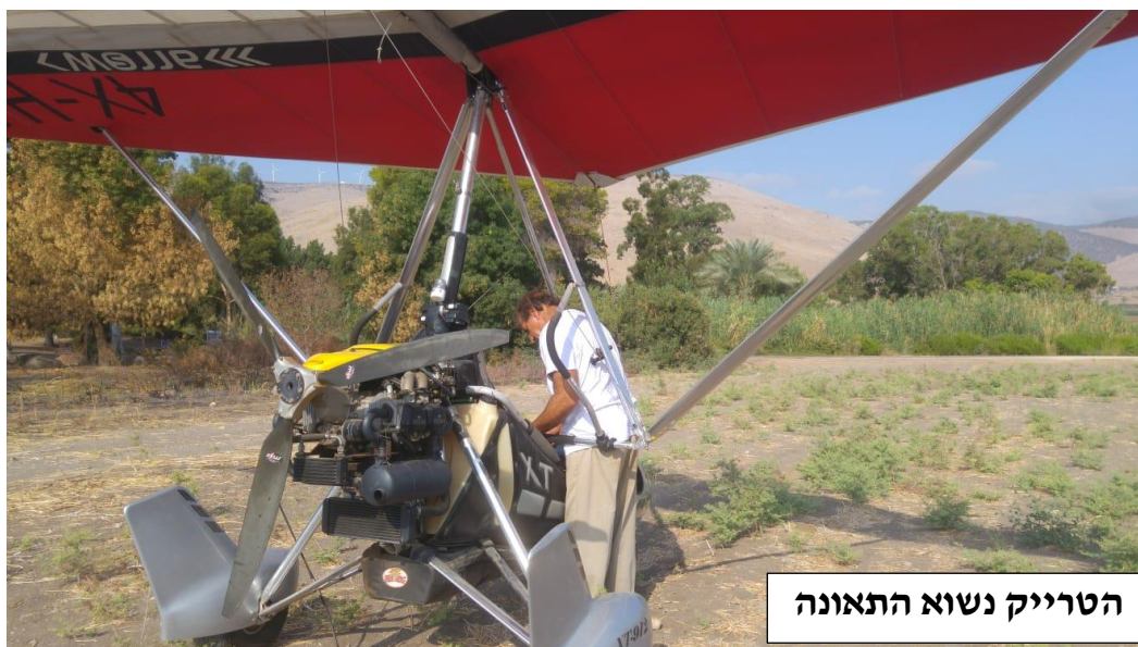
הטרייק נשוא התאונה

הרוח הייתה קלה מאד, מכיוון כללי דרום, בין אפס רוח לבין משבים קלים ביותר, כך שניתן היה לבחור את כיוון ההמראה הרצוי, ללא שום התניה.