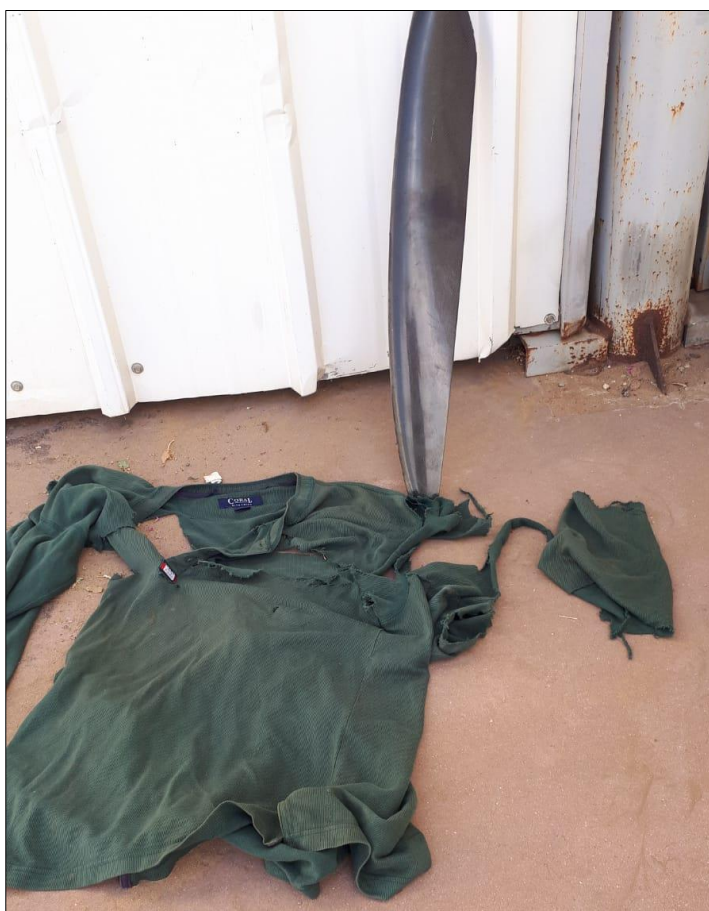
הלהב שנגזר והחולצה הקרועה שנמצאה בשטח

כשעה לאחר התאונה דיווחתי עליה לחוקר הראשי ועפ"י בקשתו שלחתי לו תמונות מזירת האירוע. החוקר תאם עמי, כי אשלח לו תחקיר אישי שיפורסם להגברת המודעות לנושא ולקידום הבטיחות.