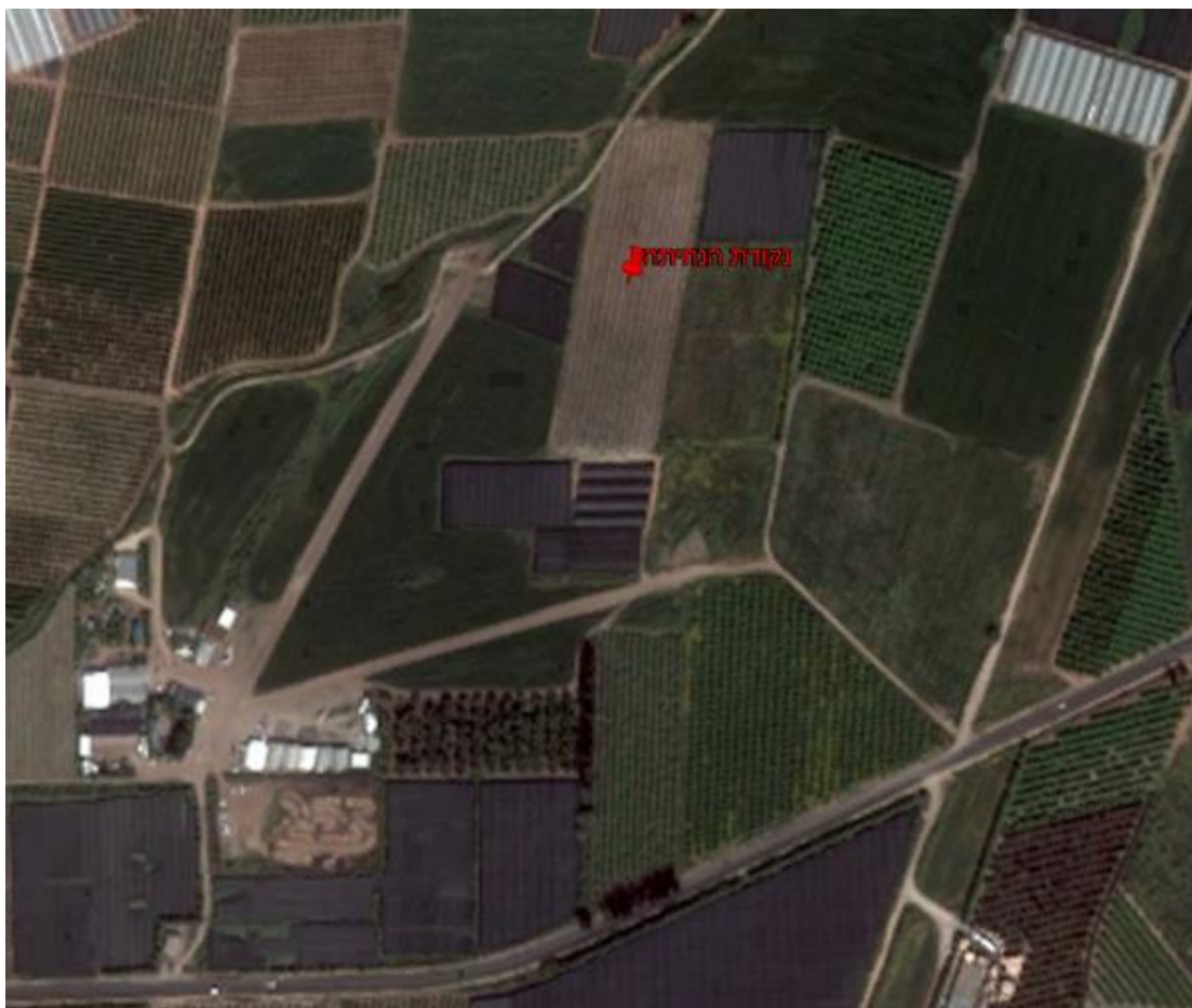
אתר התאונה בגוגל ותמונת שטח הנחיתה

התחלתי בפנייה קלה ימינה, תוך טיפוס ואז שמעתי רעש חזק מאחור, ויברציות למשך כשתי שניות והמנוע קרטע וכבה. הגובה שלי 100 רגל מעפ"ש, לערך והשדה הריק, מלפנים וימינה לי, נראה לי, באותה שנייה, כמקום הטוב ביותר לנחיתה. מה שבדיעבד הסתבר כנכון. משכתי את הבר, לשם שמירת מהירות, חידדתי את הפניה, כדי להשאיר לעצמי מעט גובה להתיישרות, לפני הנגיעה, וכך היה - נחיתה רכה וקצרה, בכיוון כללי דרום, כמאה מטרים מתחילת מסלול 25.