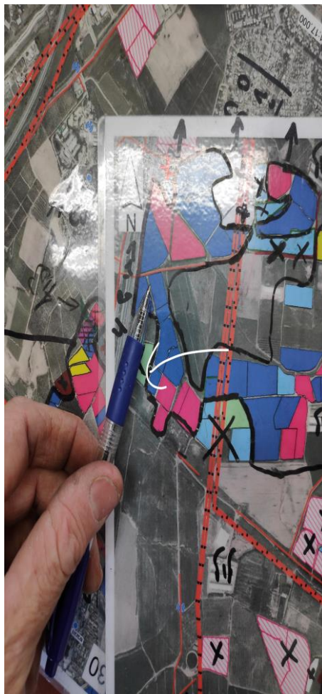
תמונת התצ"א של החלקה בה ארעה התקרית

בגיחת הריסוס הנוכחית, הטייס עבר מעל קו מתח זה במהלך ביצוע של שמונה פסים, תוך קשר עין אתו, אך במעבר האחרון, המטוס פגע עם קצה כנף ימין באחד הכבלים. הפגיעה בכבל ארעה לאחר שהטייס ביצע עקיפה של אנטנה, התיישר בפס, תוך מבט למסך ב-G.P.S והוא תיקן לפס, בהטיה ימנית, במהלכה פגעה קצה כנף ימין באחד מכבלי קו המתח. הפגיעה הורגשה כמכה קלה והמטוס המשיך להתנהג כרגיל. לאחר ביצוע בדיקת ראייה, הטייס חזר לנחיתה במנחת מגידו ממנו המריא למשימת הריסוס.