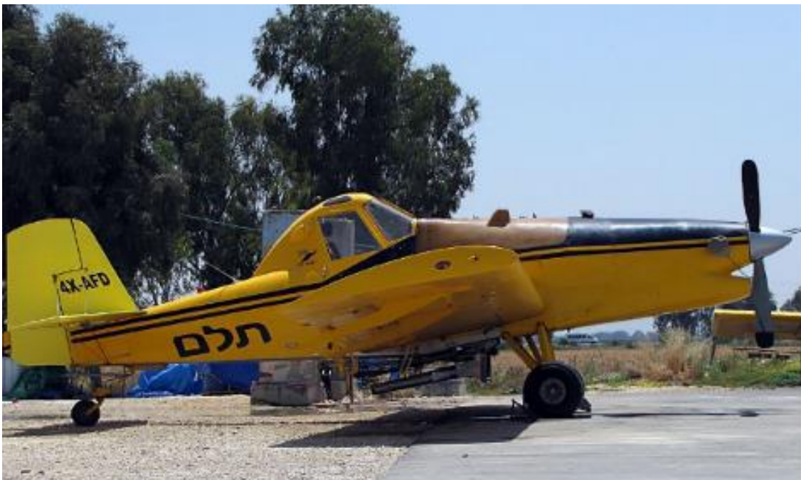
המטוס נשוא התקרית

ביום חמישי, בתאריך 13.12.2018, בשעות הבוקר המאוחרות, טייס מטוס ריסוס מסוג טורבו טראש ביצע משימה של ריסוס פרדסים, באזור בועת השרון הדרומית. סביב השעה 12:00, בעת ריסוס פרדס, הסמוך לכביש מספר 4, צפונית לשדה ורבורג, המטוס פגע עם קצה כנף ימין בכבל מתח גבוה. למטוס לא נגרם נזק פרט לסימני שפשוף בקצה הכנף. קו המתח לא ניזוק. התקרית דווחה לחוקר הראשי שלאחר בדיקת נסיבותיה סיכם עם הטייס, כי יגיש תחקיר אישי שיפורסם באתר.