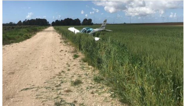
צילום מתאריך 10.3.2018

החוקר הראשי מצא לנכון ליידע את ציבור הטייסים בעובדה זו, מאחר שידוע לו שיש מי שמשתמשים בקטע השביל, הקרוי "מנחת רבדים", כשטח הפעלה. נוכח האמור, גדר זאת מונעת, למעשה, את המשך השימוש במנחת כשטח הפעלה.