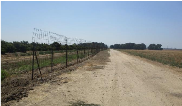
צילום מתאריך 18.8.2019

בימים אלו, נודע לחוקר הראשי, כי גדר בגובה 2 מטרים, מוקמת לאורך השול הדרומי של המסלול ואשר תוחמת את מטע עצי אבוקדו, הנטוע במקום. הגדר עשויה מרשת בניין, והיא נמצאת במרחק שבין 2-6 מטרים מציר המסלול שרוחבו 3-4 מטרים. יצוין, כי אפשר שקשה לזהות את הגדר מהאוויר.