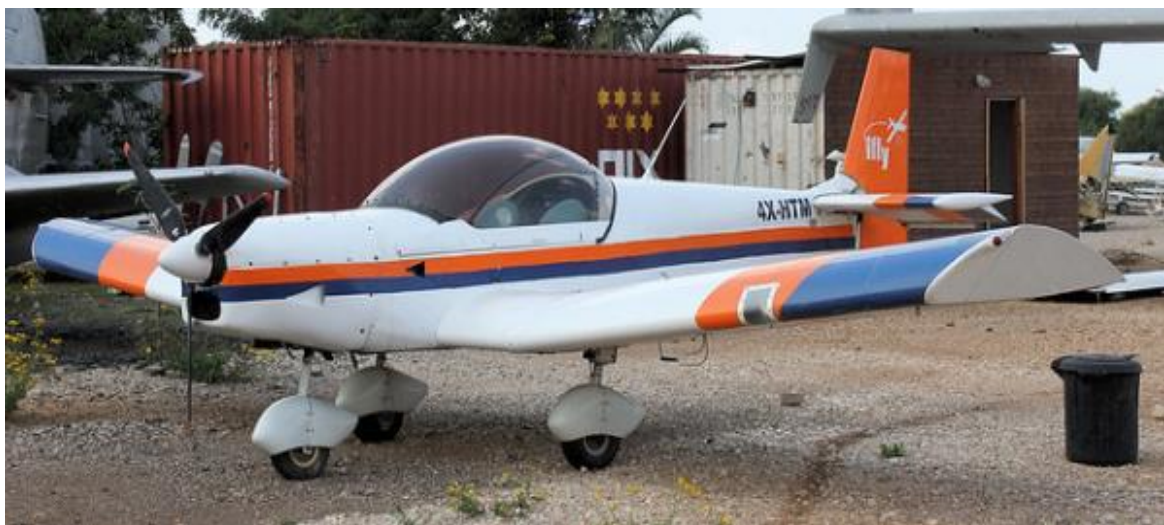
המטוס נשוא התאונה

הטייס דיווח מיד, טלפונית, לחוקר הראשי על האירוע. לאחר בדיקה ראשונית של נסיבות האירוע, כולל צפייה בסרטון שתיעד את הנחיתה מהקוקפיט, החוקר הראשי שחרר את המטוס מצרכי חקירה וסיכם עם הטייס על כתיבת תחקיר אישי שיפורסם באתר.