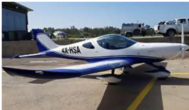
המטוס נושא התאונה

אירוע זה, השלישי במספר, בתוך שבועיים, של נפילת כוח מנוע במטוסים ממנחת ראשון, יחד עם שני אירועים נוספים שאירעו למרת היום, היוו זרז לבדיקת החשד, כי נושא הדלק, 95 אוקטן, תרם להתרחשות מרבית האירועים.